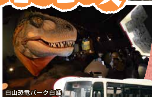
白山恐竜パーク白峰